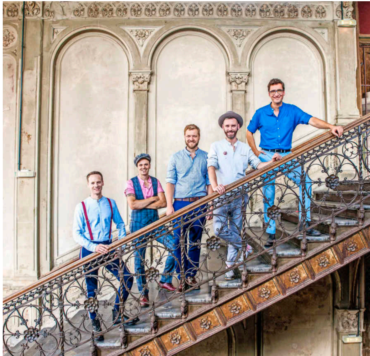
Ausklang: Das Quintett Vocaldente stimmt in Kleinwallstadts Zehntscheune am 27. November auf Weihnachten ein.

In der Zehntscheune wird Maul – dessen Themen sowohl politischer als auch gesellschaftlicher